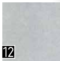
12 IFK STARDUST Pavimento cm. 33x33 colore Grigio chiaro 1 a scelta cod. 217318

16 IFK LISTELLO MARVEL MOSAICO GRIGIO 4.5x33 cm - 30 pezzi cod.217323