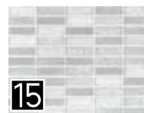
15 IFK MARVEL Rivestimento Mosaico cm. 25x33,3 colore Grigio 1 a scelta cod. 217321