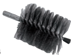
930645 Scovolo camino a elica Ø 80 mm.