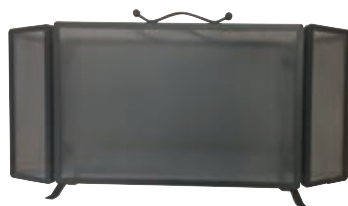
1005091 Parascintille con ali. Larghezza 100 cm: 60 cm corpo centrale + ali da 20 cm