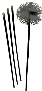
930644 Kit spazzacamino. Asta 8,40 m. Scovolo Ø 25 cm