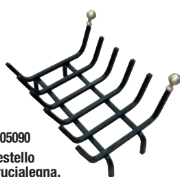
1005090 Cestello brucialegna. Misura 40x30 cm