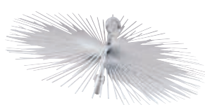
922567 Scovolo camino tondo Ø 30 cm.