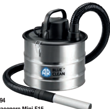
1004794 Aspiracenere Mini E15. Potenza 1000W. Tubo flessibile 120 cm, lancia 23 cm, filtro HEPA. Capacità 15 l

Ideali per pulizia stufe, caminetti e barbecue