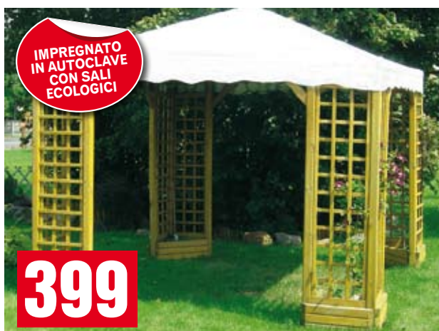
Gazebo Aosta. Completo di grigliati, fioriere integrate ad ogni angolo e telo in PVC di colore bianco. 300x300 cm. BD60026