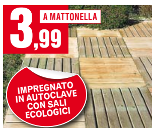
Pavimento a quadrotti. Mattonelle da 50x50 cm. IMP30