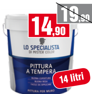
Tempera Myster Color Lo Specialista. 174573L58000