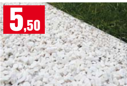
Granulato 12/16. Di colore bianco. 25 Kg. G1BIA