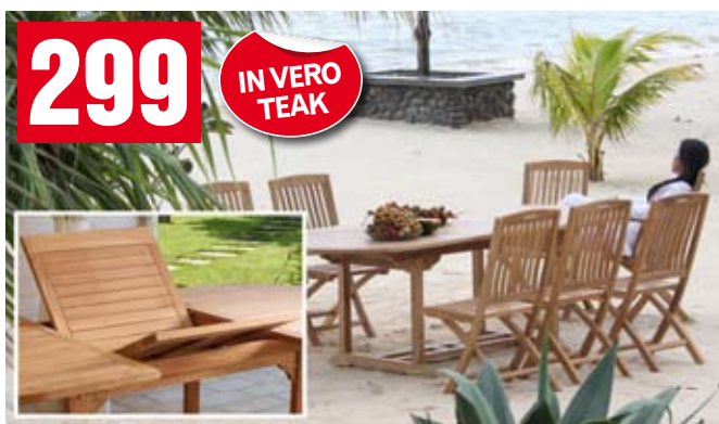
Tavolo ovale. Allungabile, da 150x90 a 200x90. ACTJ226