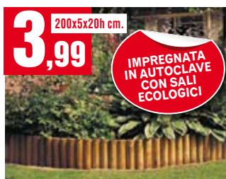
Bordura in rotolo. IMP1