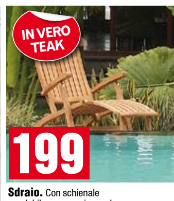
Sdraio. Con schienale regolabile e appoggio gambe ribaltabile. ACTJ181