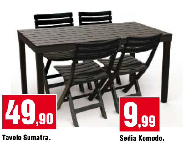
Tavolo Sumatra. Rettangolare di colore antracite. 138x80 cm. SUM028AN