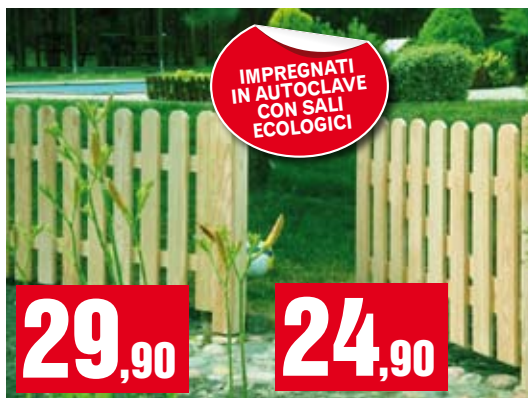
Steccato pesante. 200x100 cm. BD17624