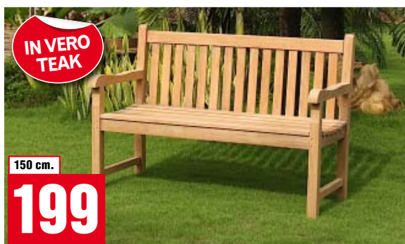
Panca Windsor Bench. Con ferramenta in ottone. ACTJ029