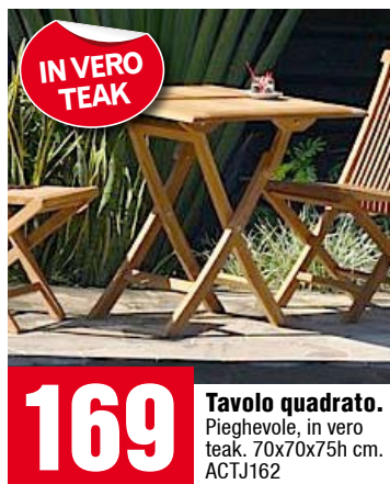
Tavolo quadrato. Pieghevole, in vero teak. 70x70x75h cm. ACTJ162