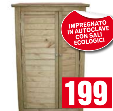
Armadio alto. Con tetto completo di guaina. 90x42x163h cm. 0329A