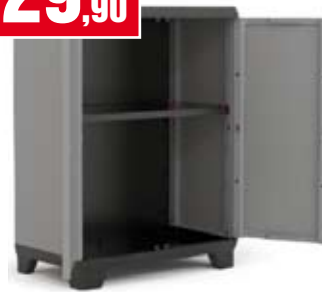
Armadio Basso. A un ripiano, portata 15 Kg. 68x39x90h cm. 9723100