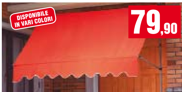
Tenda da sole Ponza. Autoportante, avvolgibile, reclinabile, con struttura in alluminio e telo in poliestere, rullo in alluminio di diametro 38 mm, barra frontale e barre di supporto in alluminio anticorrosione. Larghezza: 265 cm. 821/12 821/2