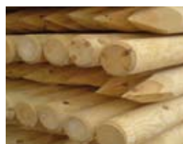
Pali con punta e senza, per recinzioni e steccati. Disponibili in lunghezze e diametri vari.