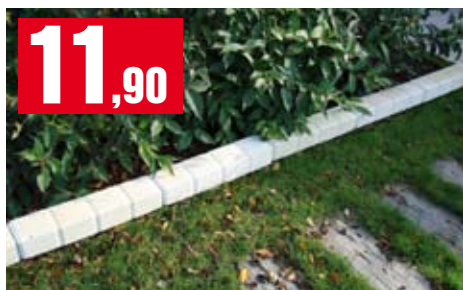
Cordolo Pavè dritto. 50x11x5,8 cm. 823.1