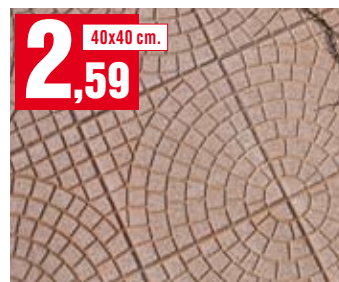
Pavimento Ventaglio levigato. Di colore rosso. 302.1