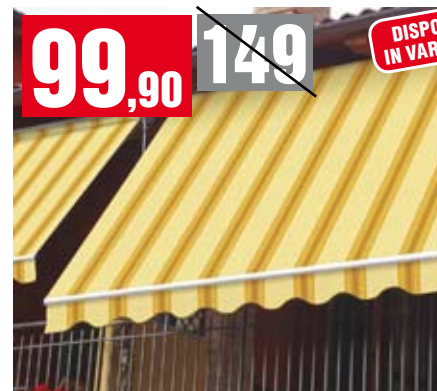
Tenda da sole Itaca. Avvolgibile con struttura in alluminio anticorrosione con barra quadra e telo poliestere completa di tutti gli accessori per il montaggio. Può essere fissata sia a soffitto che a parete. Con barra di torsione da 35 mm, rullo in alluminio diametro 58 mm, barra frontale in alluminio 47x35 mm e tessuto 280 gr./mq. 200x300 cm. 821/10 + 821