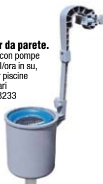
Skimmer da parete. Funziona con pompe da 3.028 l/ora in su, ideale per piscine rettangolari e ovali. 58233

Da 16,5 cm, per pastiglie da 200 g. Per pastiglie dm 7,5 cm. 58071