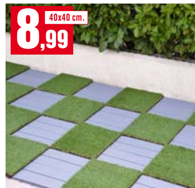
Green Plate. Prato sintetico modulare. 40x40 cm. 03ESGP40X40