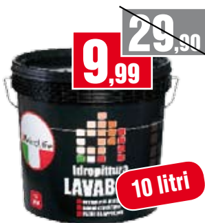
Pittura lavabile bianca. Bricolife. Ad alta copertura. 394106