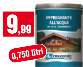
Trattamento per legno Renner. Impregnante all'acqua per esterno. RM1010128