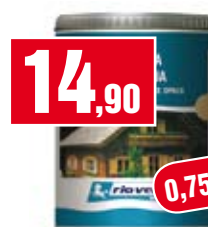
Trattamento per legno Renner. Finitura all'acqua. RF1020128