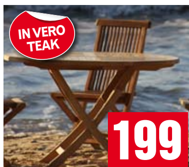
Tavolo tondo Suffolk. Pieghevole. Diametro 100 cm. ACTJ163