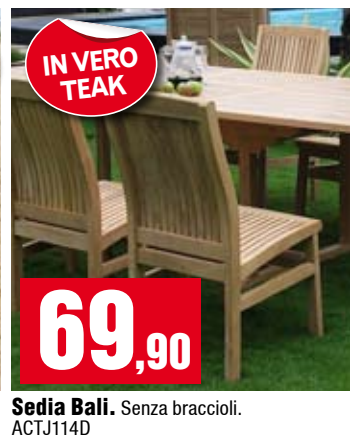
Sedia Bali. Senza braccioli. ACTJ114D