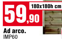
59,90 Ad arco. IMP60