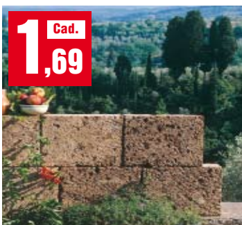
Blocchetti di tufo. Per muretti e fioriere. Pietra di origine vulcanica, selezionata e tagliata in blocchetti. 37x20x11h cm. 024