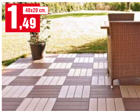
Pavimento Easyplate. Di colore caffè o cappuccino. 03EPCAFFEK14 - 03EPCAPK14