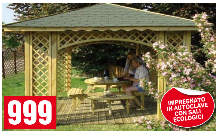
Gazebo pesante. Con grigliati, coperto con listoni (tegole canadesi escluse). 350x350 cm. BD60149