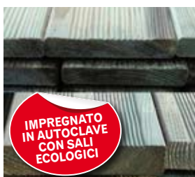
Pavimento zigrinato in pino. Disponibile in varie misure e spessori.