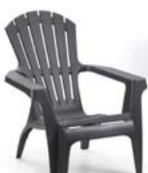
Sedia Borneo. Di colore antracite. BOR16CAN