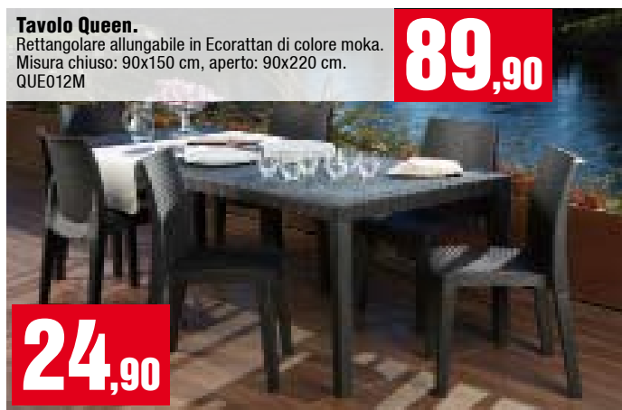
Tavolo Queen. Rettangolare allungabile in Ecorattan di colore moka. Misura chiuso: 90x150 cm, aperto: 90x220 cm. QUE012M