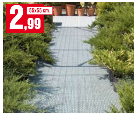
Mattonella drenante Multiplate. Di colore verde. 03MPVE