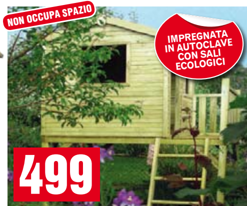
La casetta dei sogni. Casetta giochi o portattrezzi, sopraelevata, con terrazza e scala. 160x190x270h cm. BD61078