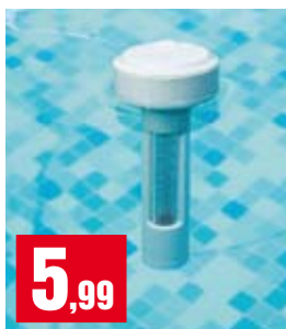
Termometro galleggiante con cordicella. 58072