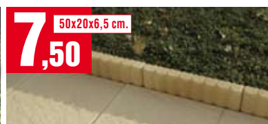
Bordura Crema. 813.2