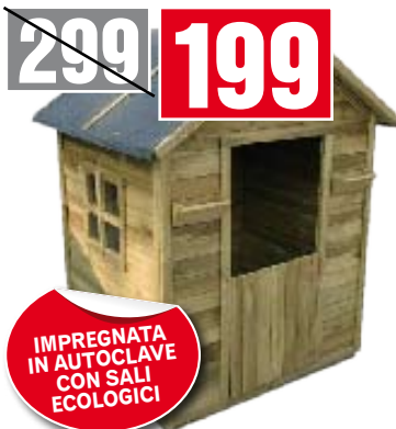
Casetta per bambini o grandi animali. Dotata di finestra, pavimento e tetto in perline con guaina. 124x113x154h cm. 0302S