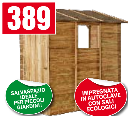
Casetta Canada addossata. È dotata di porta laterale, finestra in plexiglas, pavimento, copertura con guaina bituminosa. 201x105x217h cm. 599960