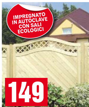
Frangivento Nicole. 180x180 cm. BD00794

TAGLI DRITTI E FUORI SQUADRO, RAGGIATURA, STONDATURA, SPIGOLATURA ECC..