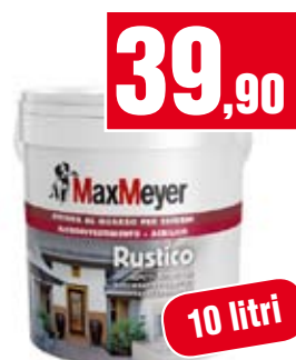
Idropittura Max Meyer. Quarzo rustico. 164617L01001