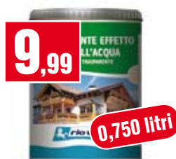
Trattamento per legno Renner. Impregnante effetto cera all'acqua per esterno. RC1030128