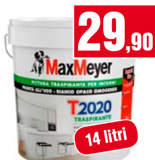
Idropittura T2020 Max Meyer. Traspirante. 164484L58000