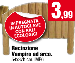
Recinzione Vampiro ad arco. 54x37h cm. IMP6