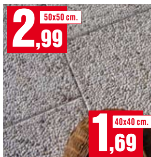
Pavimento Lavato Brenta fine. 501.3 - 503.3