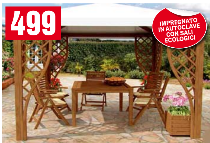
Gazebo Calice. Coperto con telo PVC, grigliati con cornice curvata lamellare. 292x292x270h cm. 08033/0