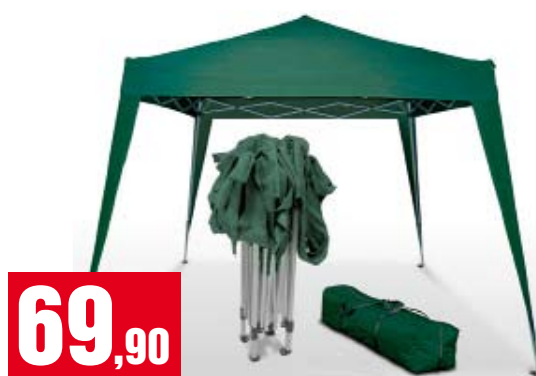
Gazebo richiudibile in metallo. Misura aperto 3x3 metri, si chiude in 30 secondi ed entra nel baule della macchina. Disponibile di colore verde o bianco. Ideale per feste, fiere e manifestazioni sportive. 02817+08802