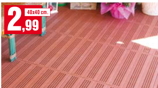
Piastrella Pehd. Di colore mattone o verde forato. 03PSROF40 - 03PSVEF40