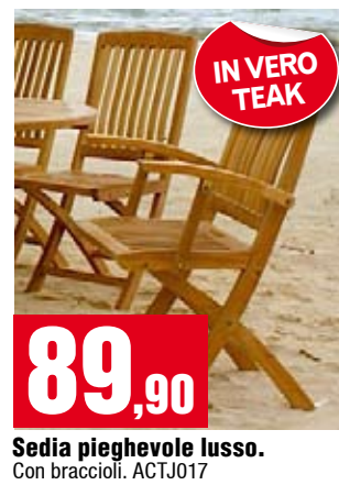
Sedia pieghevole lusso. Con braccioli. ACTJ017