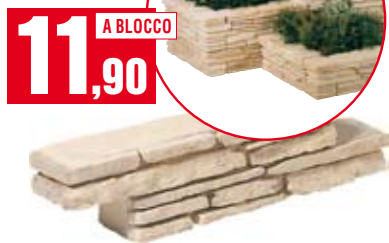
Blocco Zeta Gironda. Consente di realizzare muretti, aiuole e fioriere. 58,5x14x10 cm. ZETAGIRO