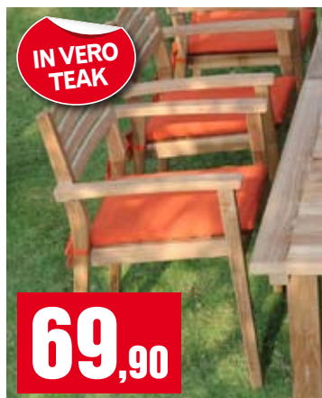
Sedia Monique. Con ferramenta in vero teak. Cuscino escluso. ACTJ140