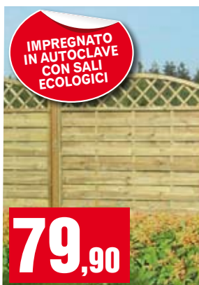
Frangivento Olga. 180x180 cm. BD03504