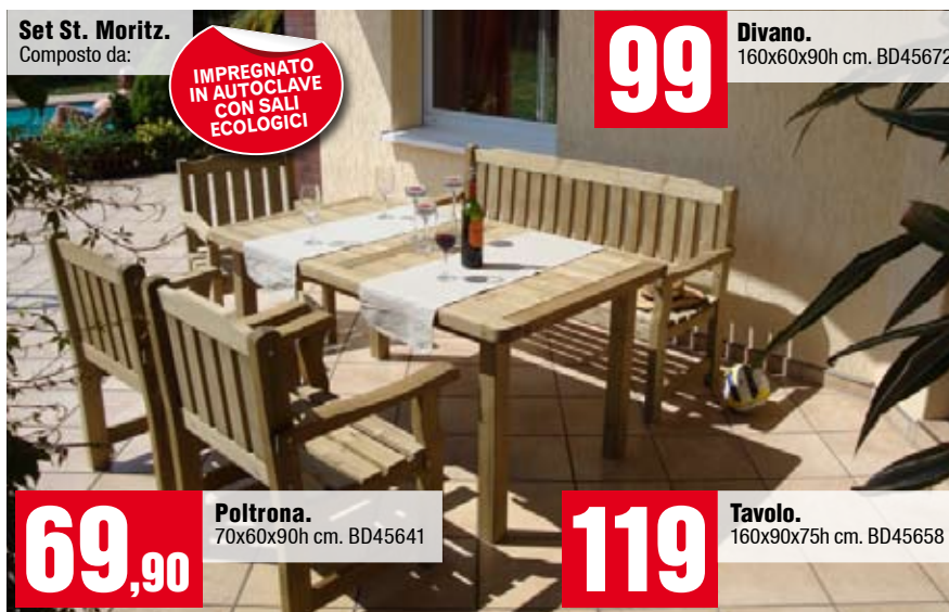
Set St. Moritz. Composto da:

IMPREGNATO IN AUTOCLAVE CON SALI ECOLOGICI