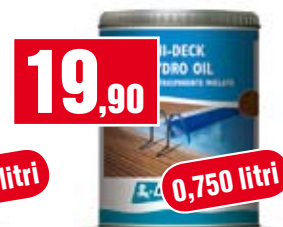
Trattamento per legno Renner Hidro-Oil. Per esterno. RK1000128