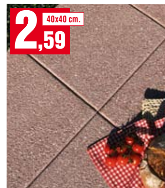
Pavimento Quarzocem. Di colore rosso. 705.2