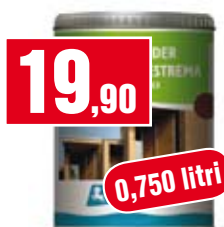
Trattamento per legno Renner UV Defender. Protezione estrema. RQ1370128