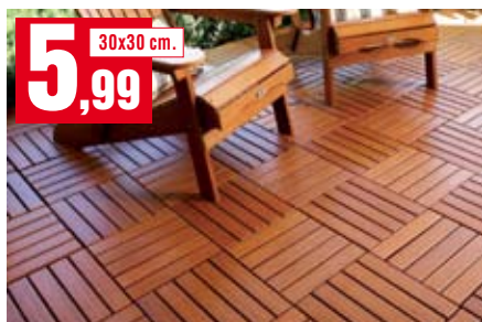
Mattonella Plustile Walnut. 030LEONNO