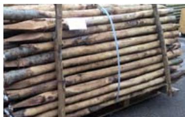
NOVITÀ! Pali in castagno ecologici. Senza alcun trattamento per viti e sostegno piante. C502P + C400P