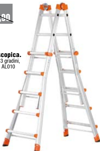
Scala Telescopica. In alluminio 3+3 gradini, portata 150Kg. AL010