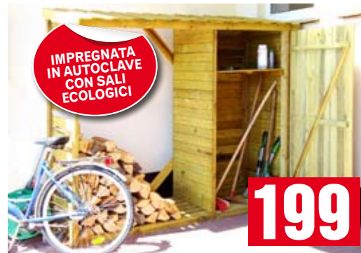
Legnaia con armadio porta attrezzi integrato. 206x65x190h cm. BD50935