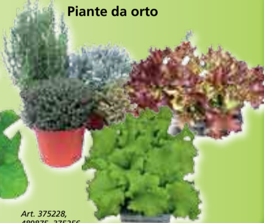
Piante da orto